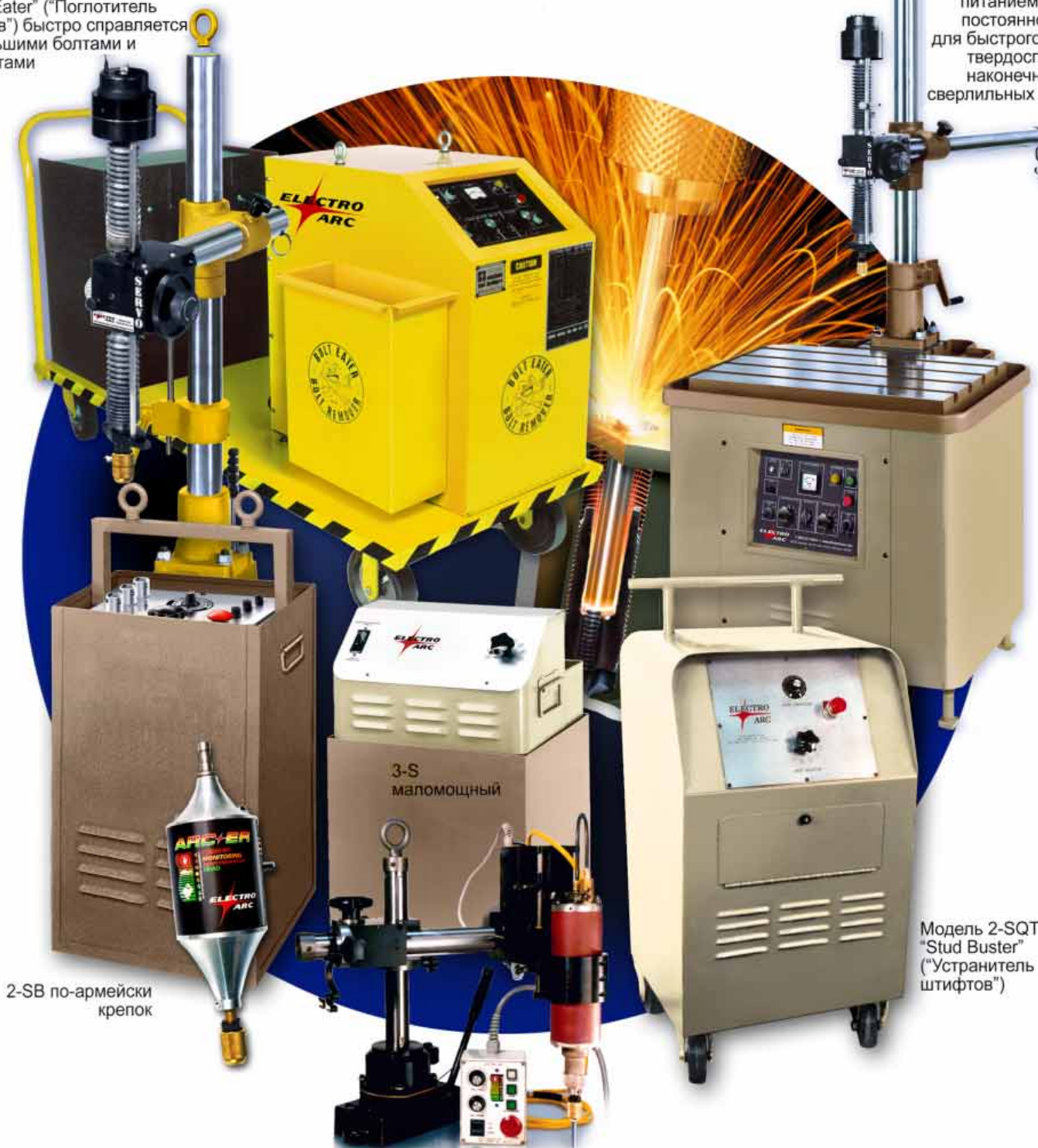
2-SB по-армейски крепко

Модель 2-SAC с питанием от сети постоянного тока для быстрого снятия твердосплавных наконечников со сверлильных головок